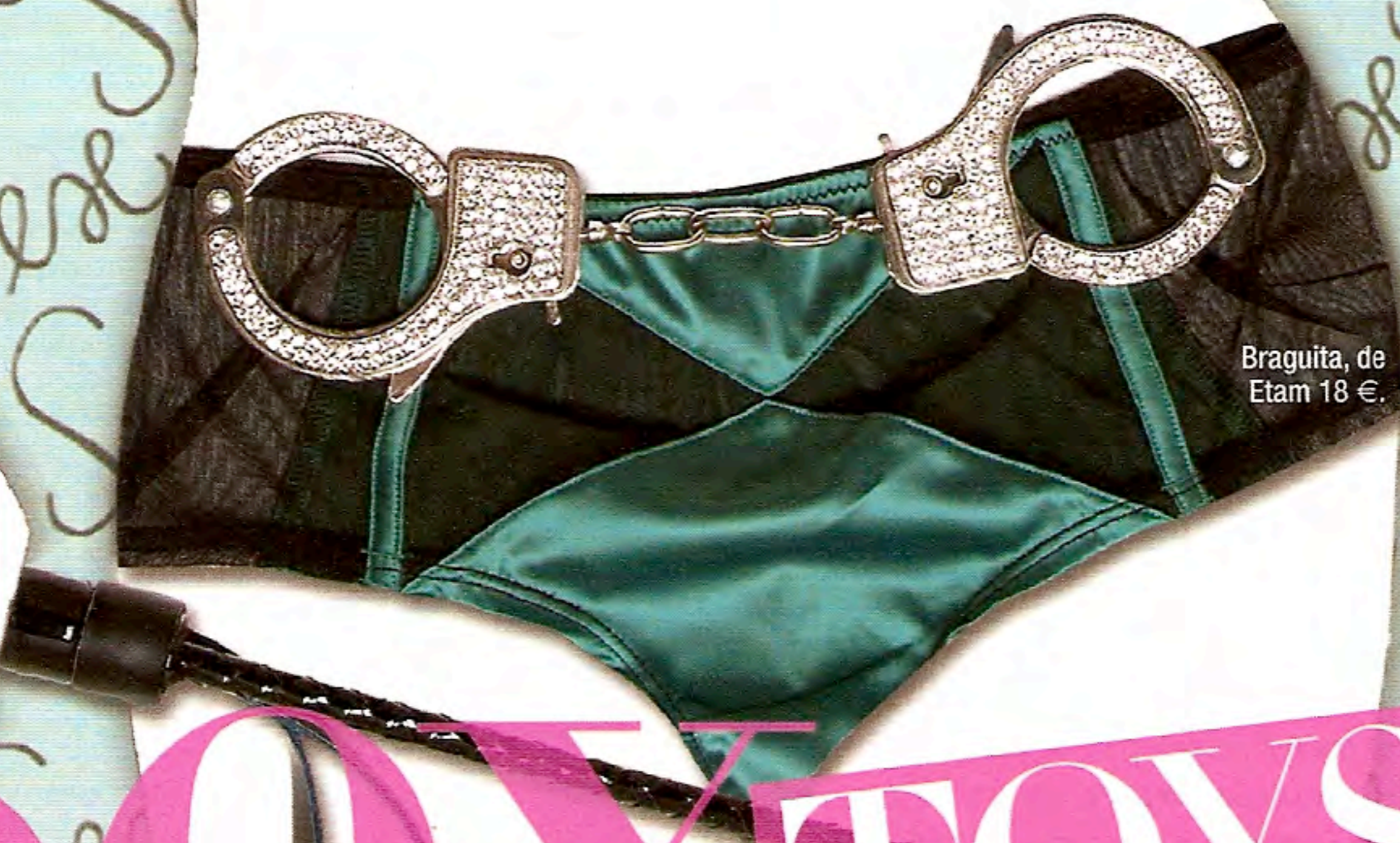
Braguita, de Etam 18 €.